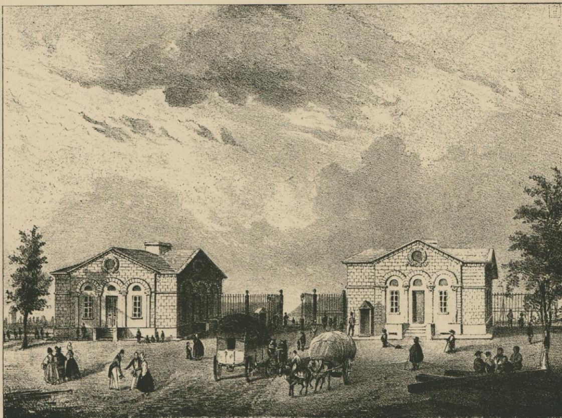
PORTE DE NINOVE.

plus sortie de la remise depuis quinze ou vingt ans. Et tout cela était rempli de riantes figures de femmes qui bravaient courageusement les dangers d'une haute température, qui, ce jour-là, se résignaient à la patience, payant trois ou quatre minutes de plaisir par une attente souvent assez longue. Il fallait voir nos cavaliers, depuis le dandy , nonchalamment conduit par son coursier de pure race, jusqu'au